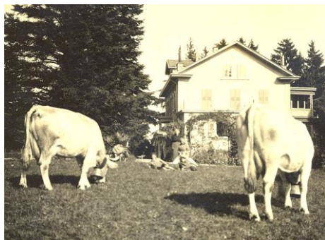
Vue de la façade sud en 1931

1931 Construction en briques de l'annexe sud à l'habitation.