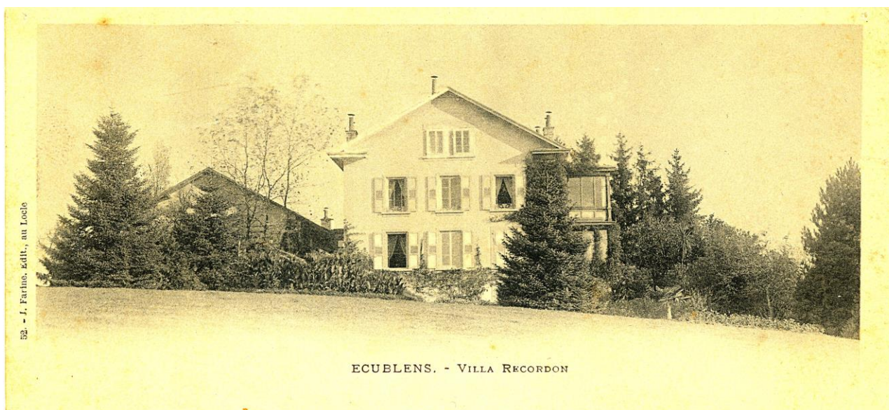
La villa Mon Repos vers 1900